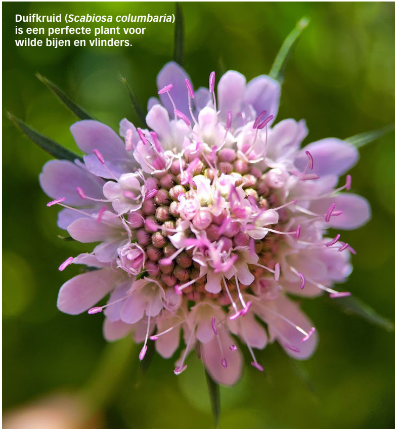
Duifkruid ( Scabiosa columbaria ) is een perfecte plant voor wilde bijen en vlinders.