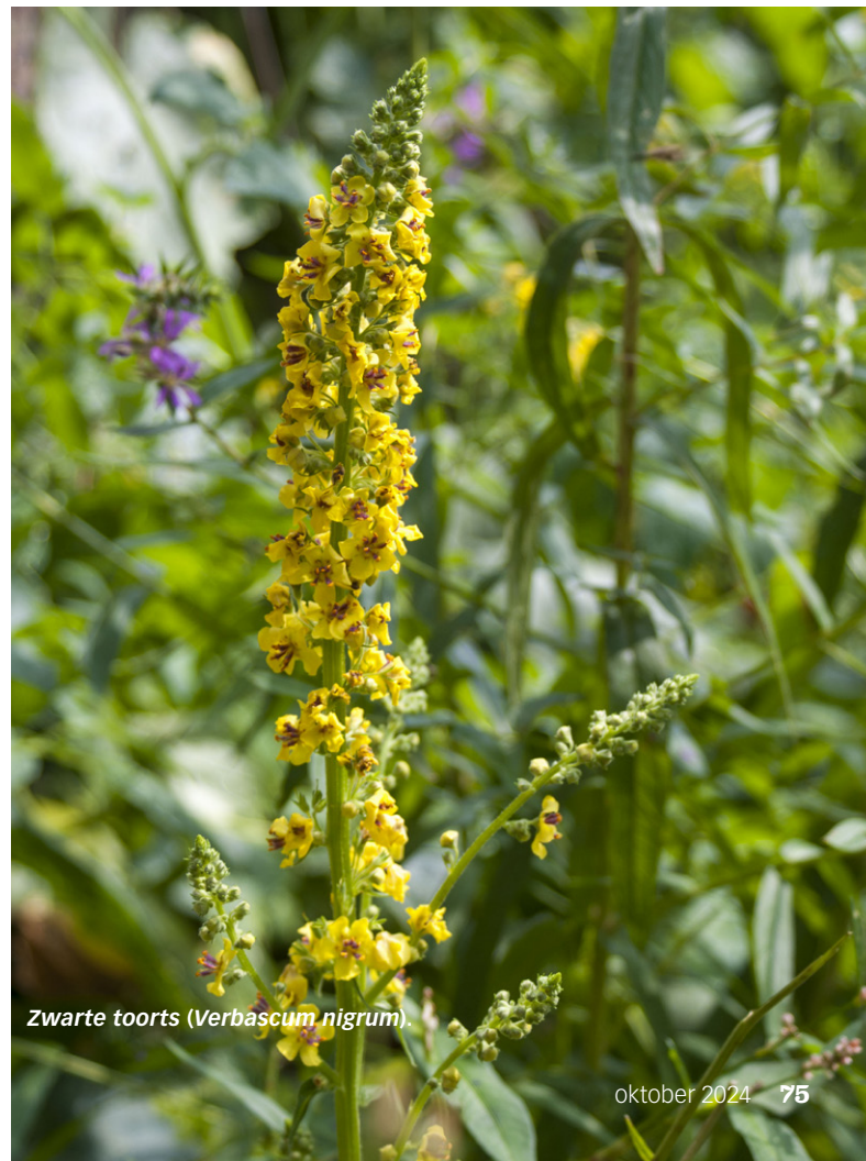
Zwarte toorts (Verbascum nigrum).